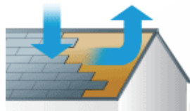
通気性に優れ下葺材も長持ち